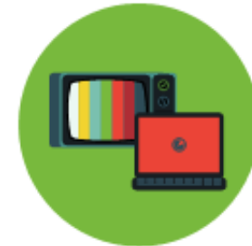
TV E INTERNET