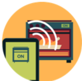
INTERNET OF THINGS